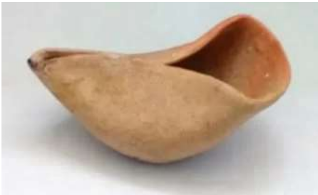
נר חשמונאי צבוט

בשפת התנ"ך והמשנה 'נר' נקרא הכלי שמחזיק בתוכו את חומר הבעירה של האש. ואילו הכלי מרובה הקנים שבקצבותיו נרות נקרא 'מנורה'. הנר, כלי התאורה המרכזי אשר דלק בכל בית, עשוי על פי רוב חרס, ובו פתילה הדולקת בשמן (לרוב שמן זית).