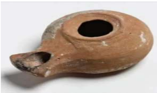
נר הרודיאני.

המילה נר גזורה מן השורש נ.ו.ר, המציין אור ואש. מילה נוספת משורש זה היא נור . "על המנרה הטהרה יערך את הנרות לפני ה' תמיד" (ויקרא כד, ד). בעת המודרנית נפרדה המנורה מן הנרות, וקיבלה בת לוויה חדשה מן השורש נ.ו.ר: נורה. שם נוסף מהשורש נ.ו.ר הוא לפרח נורית : כאשר