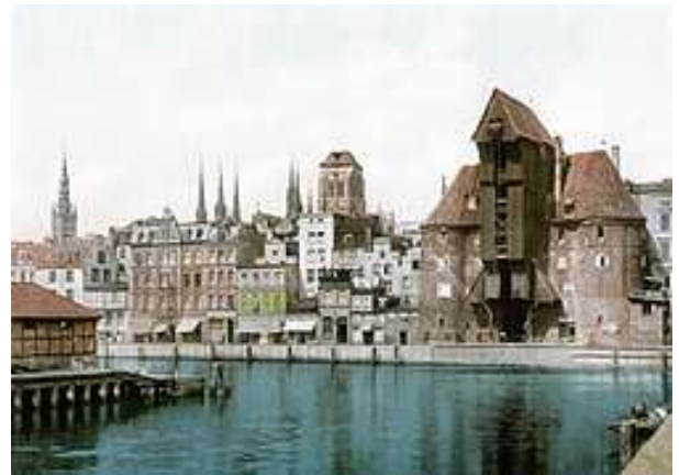
גדנסק (דנציג) בסוף המאה ה-19

כמרקחה, מצעד של דודות ובנות דודות ניסה לשנות את דעתה, כל אחת בדרכה, אבל היא בשלה, מסרבת בכל תוקף. השידוך בוטל, הבושה הייתה קשה מנשוא, עולמו של אביה, חרב עליו והיא נזרקה מביתה כשרק בגדיה לעורה. איש מקרובי משפחתה לא העז לדבר איתה, כשעברה לידם הם הפנו את ראשם כאילו שאינם מכירים אותה. הנידוי היה מוחלט. בגיל עשרים בערך מצאה את עצמה לבד, מנותקת מכל מה שידעה והכירה, מנותקת ממשפחתה ומהקהילה. הנה, היא חייכה לעצמה, עברו שנתיים, שנתיים של מאבקים ועבודה קשה, שנתיים אין סופיות במתפרה הטחובה במרתף העלוב ועכשיו, אחרי שאספה פרוטה לפרוטה, עכשיו היא בדרך לאמריקה.