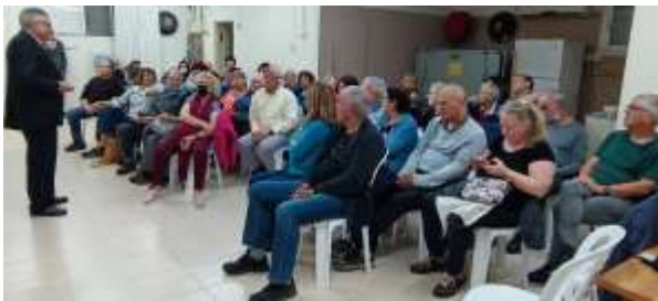
הרצאה רבת משתתפים צילום נעמי סיון