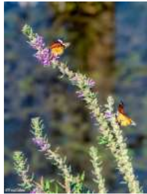
צילום הפרפרים יוסי וונג